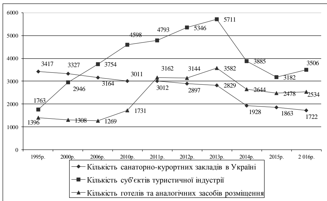
Рис.1. Кількість підприємств туристичної індустрії в Україні упродовж 1995–2016 рр., од. Джерело: складено та розраховано за даними статистичної звітності [8,9,10,11]

Розвиток туристичної індустрії в Україні характеризується перш за все показниками діяльності підприємств, що належать до її структури (підприємства готельного господарства, суб'єкти туристичної діяльності, підприємства санаторно-курортної сфери) (рис.1).