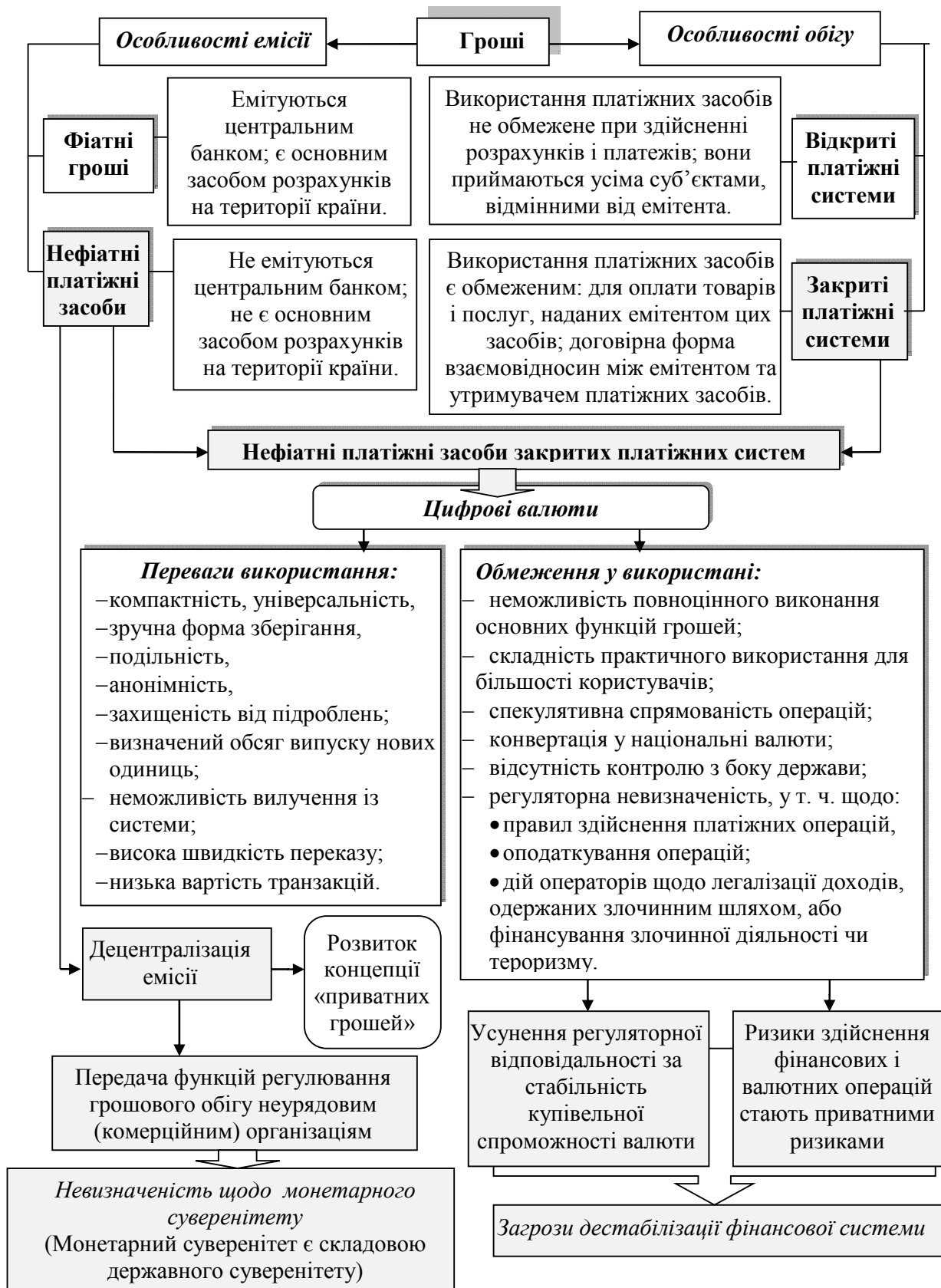
Рис. 2. Переваги та обмеження у використанні цифрових валют