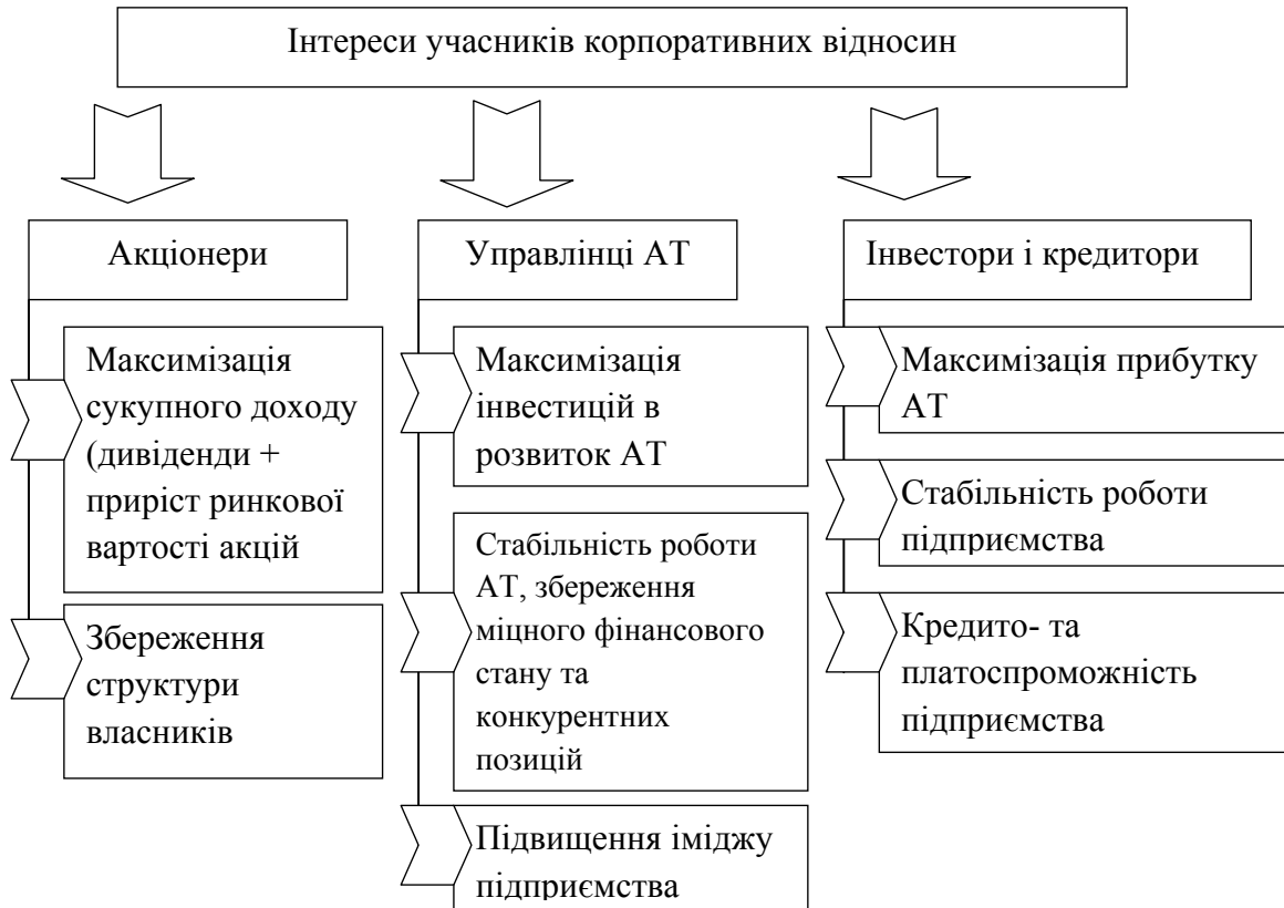
Рис. 1. Сукупність інтересів учасників корпоративних відносин