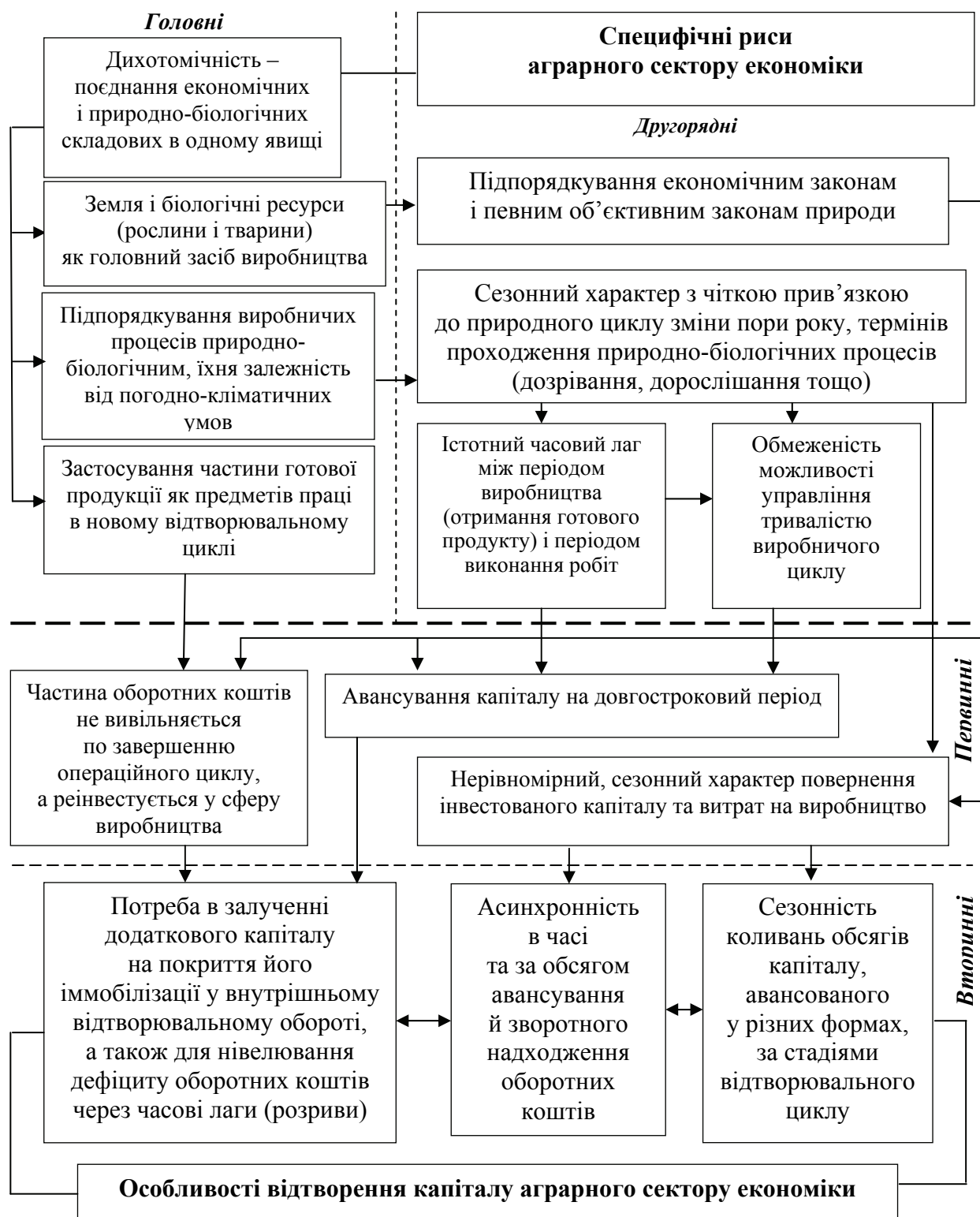
Рис. 1. Каузальна модель формування особливостей відтворення капіталу аграрного сектору економіки