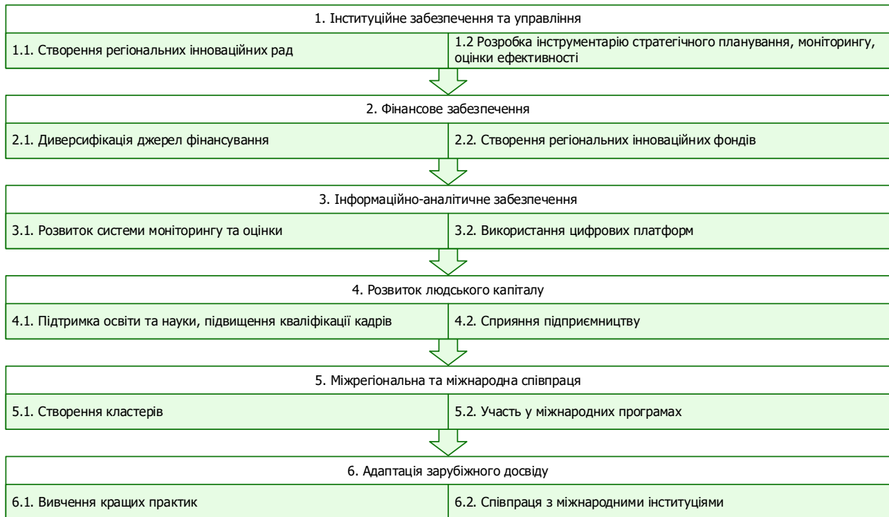
Рис. 2. Напрями вдосконалення організаційно-економічного механізму смарт-спеціалізації розвитку регіонів в Україні.

Під розвитком людського капіталу розуміємо потребу підтримки освіти й науки, особливо в галузях, які відповідають пріоритетам смарт-спеціалізації, що сприятиме формуванню висококваліфікованих кадрів і розвитку інноваційного потенціалу регіонів; підвищенню компетентності в царині стратегічного планування, управління проектами та інноваційної діяльності. Для цього варто запровадити програми навчання для працівників органів влади та інших учасників процесу смарт-спеціалізації. Також важливим є сприяння підприємництву шляхом надання консультаційних послуг, доступу до фінансування та підтримки стартапів.