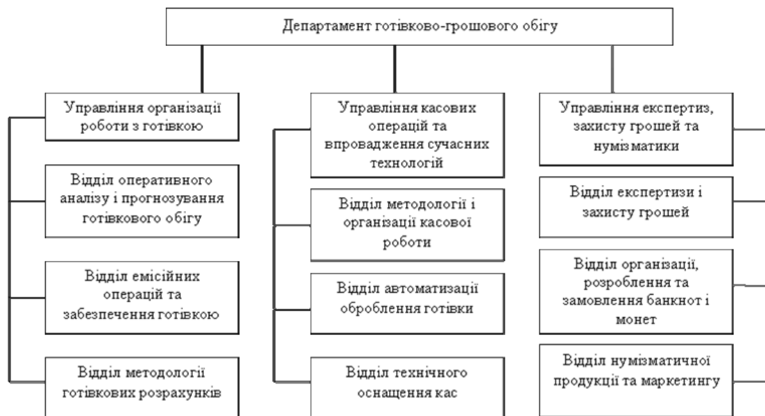
Рис.1. Функціональна структура Департаменту готівково-грошового обігу [9]

Виходячи з завдань і функцій Департаменту, можна вважати, що, з точки зору інституційної структури, він основний організаційний елемент системи безпосередньої організації, регулювання та контролю готівкового грошового обігу в країні.