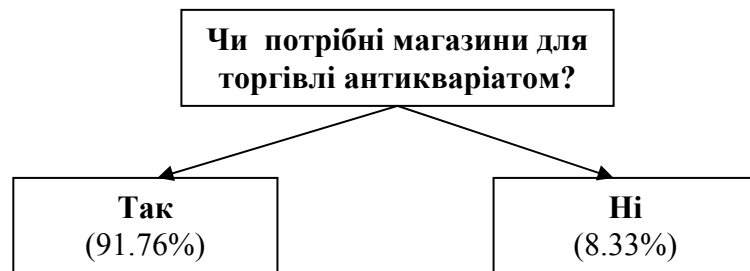
Рис.2. Необхідність антикварних магазинів, ((у %), авторське дослідження)

Наступне питання стосувалось доцільності використання магазинів для торгівлі предметами антикваріату в Україні. За даними опитування 91.76% вважали функціонування таких магазинів необхідним, і тільки 8.33% не бачили у них потреби (рис. 2).