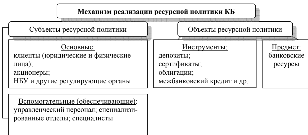
Рис. 1. Механизм реализации ресурсной политики коммерческого банка 1

В научной литературе нет общего мнения относительно структуры механизма реализации политики коммерческого банка. На основании обобщения существующих определений «механизма» [1, 2, 4, 10] может быть предложена следующая трактовка механизма реализации ресурсной политики банка : целенаправленно созданная, взаимодействующая совокупность субъектов и объектов рынка с учетом влияющих на них принципов, социально-экономических рычагов, методов, юридических норм с целью формирования банковских ресурсов (см. рис. 1). От эффективности функционирования данного механизма во многом зависит успешное выполнение целей и задач, которые ставятся банком в процессе разработки и проведения ресурсной политики.