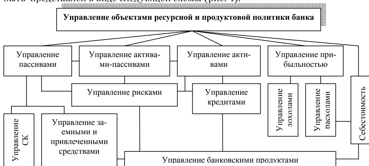
Рис. 4. Схема управления объектами ресурсной и продуктовой политики банка 4

Взаимосвязь ресурсной и продуктовой политики проявляется в процессе управления их объектами. В настоящее время в современной экономической литературе как самостоятельные элементы банковского финансового менеджмента подробно рассмотрены проблемы управления: пассивами, активами, ликвидностью, прибылью банка, рисками, однако не существует единого подхода относительно управления объектами ресурсной и продуктовой политики банка. На основе изучения достаточно широкого спектра научной литературы [11, 12, 13, 14, 15] процесс управления объектами ресурсной и продуктовой политики может быть представлен в виде следующей схемы (рис. 4):